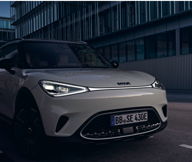
7. Charakteristische Außenbeleuchtung

1. Schwebende Mittelkonsole: völlig neues Design durch Reduktion der Elemente und überlegene Raumeffizienz • 2. Halo Glasdach: nahtloses Panoramadach unterstützt die Themen Licht und Raum • 3. Digitaler Schlüssel & Autofernbedienung: Hinzufügen einer smart ID ermöglicht die gemeinsame Nutzung des digitalen Schlüssels über die smart-App • 4. Verdeckte Türgriffe: elektronische Türgriffe mit indirekter Beleuchtung, die automatisch erkennen, wenn sich Benutzer:innen mit einem Schlüssel nähern • 5. Großer Bildschirm für individuelle Benutzeroberfläche: 12,8 Zoll Touch-Display mit 1920x1080 Pixel zum Anpassen • 6. Ambient Light: individuell einstellbare Ambientebeleuchtung mit 64 Farben und 20 Beleuchtungsstufen • 7. Charakteristische Außenbeleuchtung: mit Matrix-LED-Scheinwerfern, Flüssigkeitsanzeige und Y-förmigen Lichtbändern, vorne und hinten • 8. Beats high-end Soundtechnologie: Premium-Audiosystem bestehend aus einem Verstärkermodul und 13 Lautsprechern inklusive Subwoofer • 9. Wandelbarer Kofferraum: die verschiebbare Rückbank ermöglicht eine variable Ladefläche. Die Sitze sind im Verhältnis 60:40 geteilt und können bis zu 13 cm nach vorne geschoben werden • 10. Umfangreicher smart Pilot: smart Pilot inklusive Stop & Go sowie Autobahn- & Stauassistent