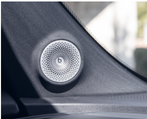
8. Beats high-end Soundtechnologie