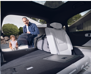
9. Wandelbarer Kofferraum