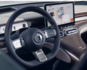
10. Umfangreicher smart Pilot

Das Fahrzeug befindet sich im EU-Homologationsverfahren und es wird erwartet, dass das Verfahren in der zweiten Jahreshälfte 2022 abgeschlossen ist. smart wird die Werte über seine üblichen Kanäle veröffentlichen. Die abgebildeten Fahrzeuge können optionale Ausstattung und Funktionen enthalten, die möglicherweise nicht auf allen Märkten verfügbar sind.