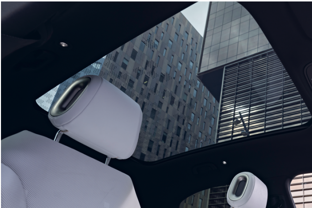
2. Halo Glasdach