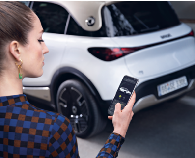
3. Digitaler Schlüssel & Autofernbedienung