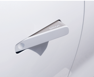
4. Verdeckte Türgriffe