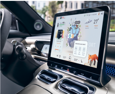
5. Großer Bildschirm für eine individuelle Benutzeroberfläche