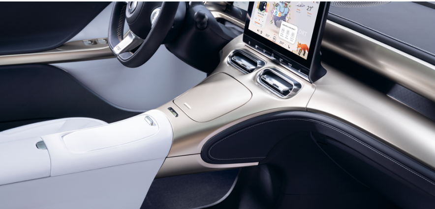
1. Schwebende Mittelkonsole