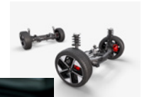
BRABUS FAHRMODUS AWD-SYSTEM

0-100 KM/H IN 3,9 SEK, 315 KW, 543 NM Stromverbrauch kombiniert in kWh/100 km: --- (NEFZ) / 17,9 (BRABUS); CO2-Emissionen kombiniert in g/km: 0; Elektrische Reichweite (WLTP) in km: 400 (BRABUS)