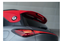
UNVERWECHSELBARE LACK- UND FARB-KOMBINATIONEN