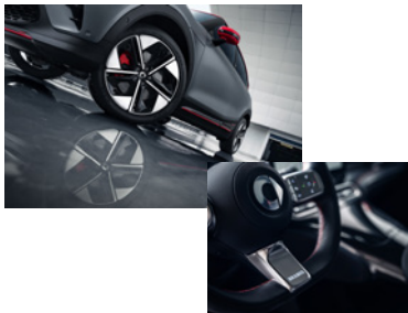
GRIFFIGES ALCANTARA LENKRAD